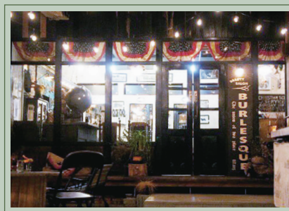
ヘアサロン&カフェの BURLESQUE

見学 ▶ ヘアサロン&カフェ BURLESQUE セルフリノベーションの魅力的な店内を見学、 七条の若き創業者からお話を聞く絶好の機会。